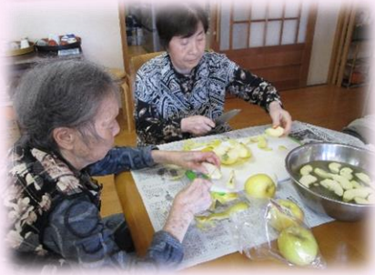
今日のデザートはリンゴです