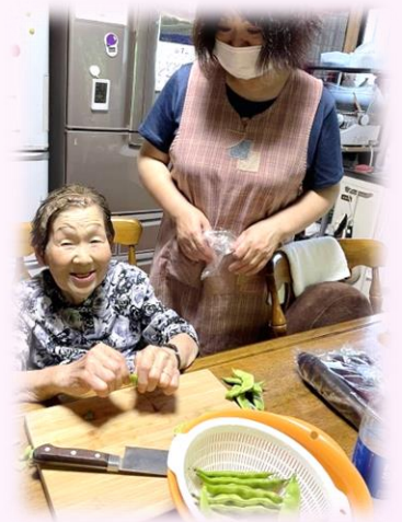
自宅で一緒に食事作り

また、多種多様なニーズに対しても状況に応じて対応しており、困りごとや不安を早急に取り除き安心して暮らしていける手助けを行っています。